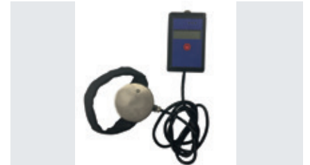
Pedal force meter