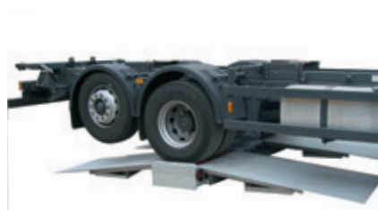
Drive-on /-off ramps