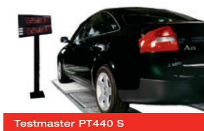
Testmaster PT440 S

Архангельск (8182)63-90-72 Астана (7172)727-132 Астрахань (8512)99-46-04 Барнаул (3852)73-04-60 Белгород (4722)40-23-64 Брянск (4832)59-03-52 Владивосток (423)249-28-31 Волгоград (844)278-03-48 Вологда (8172)26-41-59 Воронеж (473)204-51-73 Екатеринбург (343)384-55-89 Иваново (4932)77-34-06