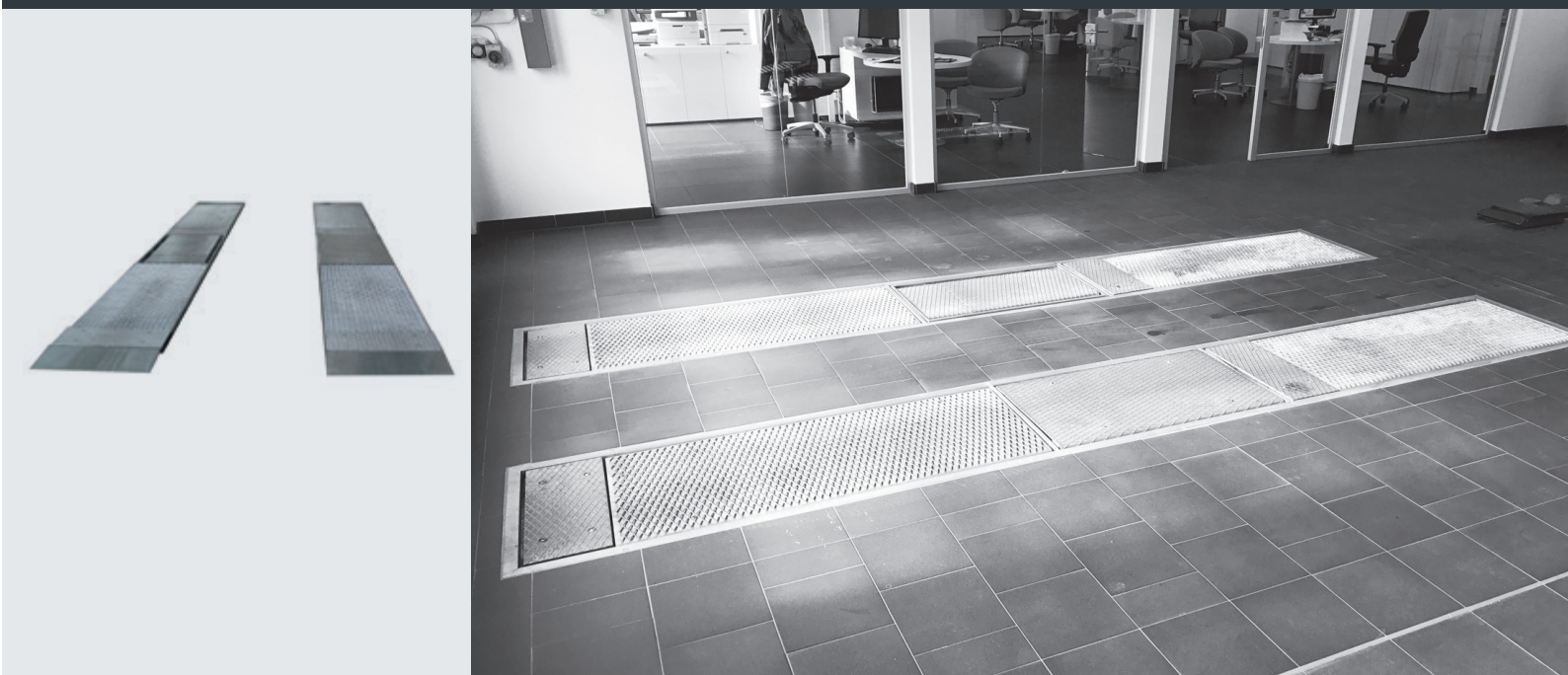
Plate brake tester