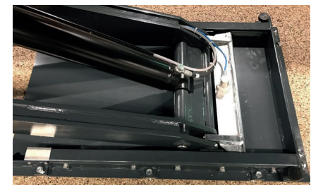
Adjustable base frame