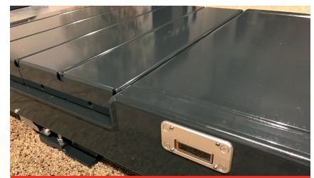
Infra-red sensor and fillers

Архангельск (8182)63-90-72 Астана (7172)727-132 Астрахань (8512)99-46-04 Барнаул (3852)73-04-60 Белгород (4722)40-23-64 Брянск (4832)59-03-52 Владивосток (423)249-28-31 Волгоград (844)278-03-48 Вологда (8172)26-41-59 Воронеж (473)204-51-73 Екатеринбург (343)384-55-89 Иваново (4932)77-34-06