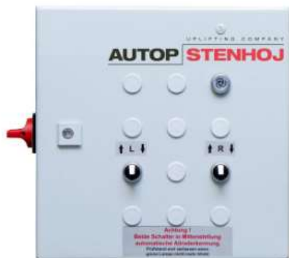
Электрический блок управления

В стандартной комплектации тест линии, для управления, идет дистанционный пульт, дальность связи до 12 метров: тип - I (для версии с дисплеем), тип - IPC (для версии с подключением к ПК). Опционально можно заказать дистанционный пульт управления с дальностью связи до 50 метров и дополнительным управлением устройством подъема / опускания порога (тип - R/RPC).