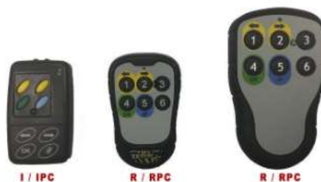
Пульты дистанционного управления тест линией