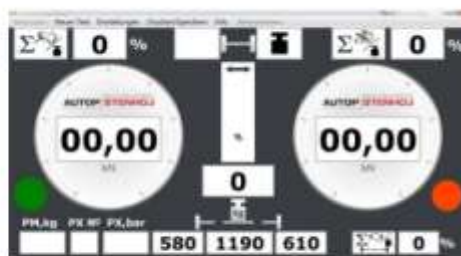
Вывод информации на ПК