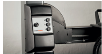
Pump and control unit on front left post