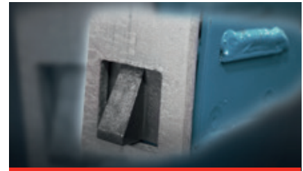
Ratchet for parking position