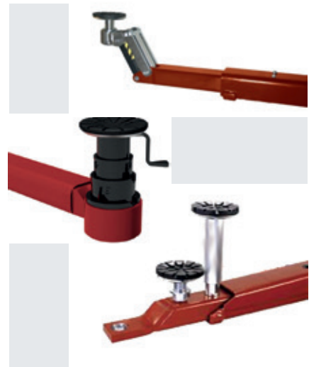
CF-pad / CF-08 pad / F-pad