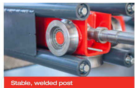
Stable, welded post

Архангельск (8182)63-90-72 Астана (7172)727-132 Астрахань (8512)99-46-04 Барнаул (3852)73-04-60 Белгород (4722)40-23-64 Брянск (4832)59-03-52 Владивосток (423)249-28-31 Волгоград (844)278-03-48 Вологда (8172)26-41-59 Воронеж (473)204-51-73 Екатеринбург (343)384-55-89 Иваново (4932)77-34-06