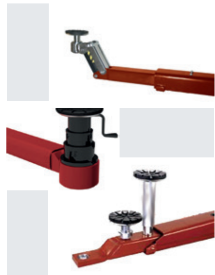
CF-pad / CF-08 pad / F-pad