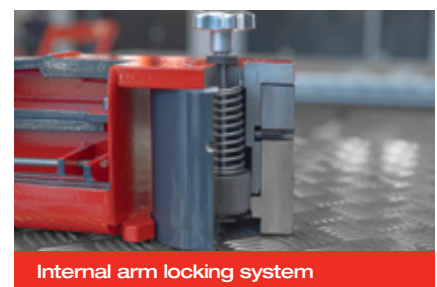
Internal arm locking system

Архангельск (8182)63-90-72 Астана (7172)727-132 Астрахань (8512)99-46-04 Барнаул (3852)73-04-60 Белгород (4722)40-23-64 Брянск (4832)59-03-52 Владивосток (423)249-28-31 Волгоград (844)278-03-48 Вологда (8172)26-41-59 Воронеж (473)204-51-73 Екатеринбург (343)384-55-89 Иваново (4932)77-34-06