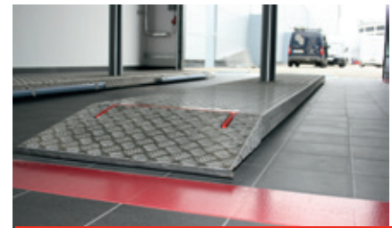
Low platform construction