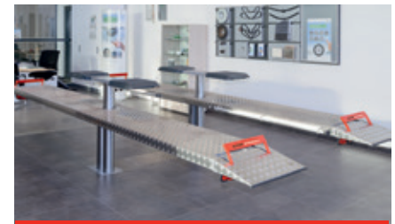
Lift in reception area