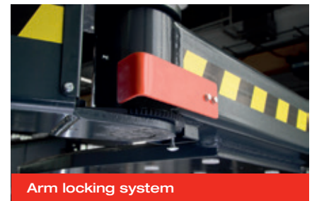
Arm locking system

Архангельск (8182)63-90-72 Астана (7172)727-132 Астрахань (8512)99-46-04 Барнаул (3852)73-04-60 Белгород (4722)40-23-64 Брянск (4832)59-03-52 Владивосток (423)249-28-31 Волгоград (844)278-03-48 Вологда (8172)26-41-59 Воронеж (473)204-51-73 Екатеринбург (343)384-55-89 Иваново (4932)77-34-06