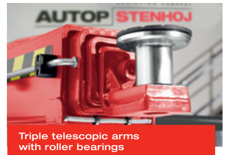
Triple telescopic arms with roller bearings