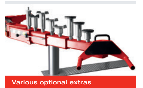
Various optional extras