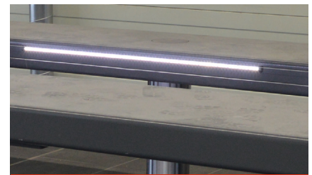
LED lighting set

Архангельск (8182)63-90-72 Астана (7172)727-132 Астрахань (8512)99-46-04 Барнаул (3852)73-04-60 Белгород (4722)40-23-64 Брянск (4832)59-03-52 Владивосток (423)249-28-31 Волгоград (844)278-03-48 Вологда (8172)26-41-59 Воронеж (473)204-51-73 Екатеринбург (343)384-55-89 Иваново (4932)77-34-06