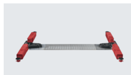
Superstructure on floor