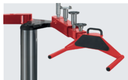
Superstructure with lifting pads and wheel adaptors